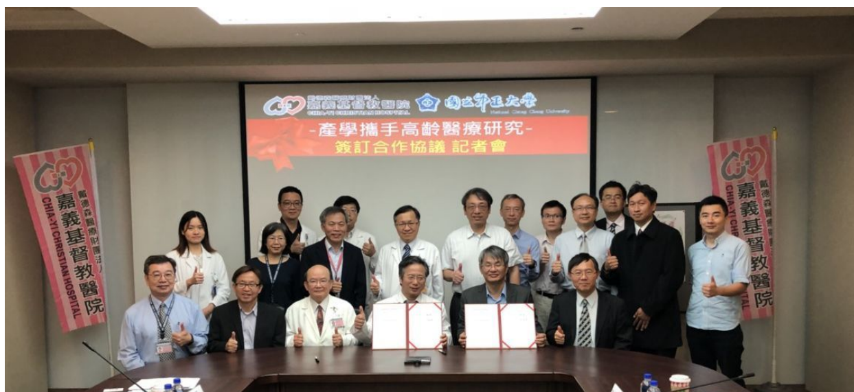
銀髮海嘯浪潮來襲，高齡醫療研究成為顯學。嘉義基督教醫院與中正大學跨域合作，今天簽訂合作協議，醫學、科技、人文相輔相成。