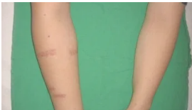
當保守治療無法改善肢體淋巴水腫！ 2020-03-12 在「台中市」中