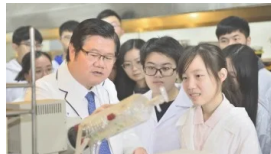
開發免疫檢查點新標靶 增進癌症免疫治療療效 2020-03-30 在「台中市」中