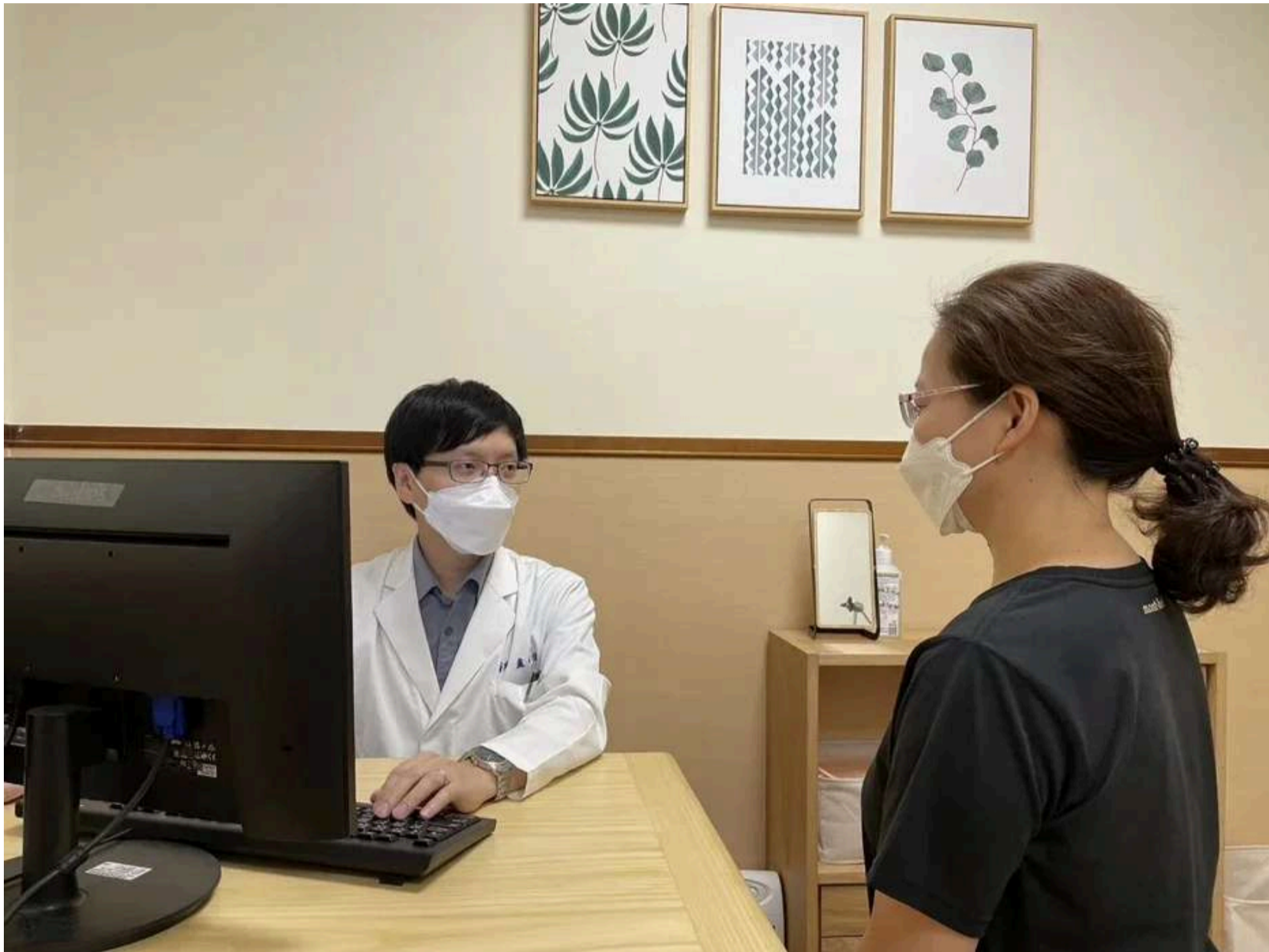
嘉基引進磁波調節治療，幫憂鬱症媽媽大腦重開機。圖 / 嘉義基督教醫院提供