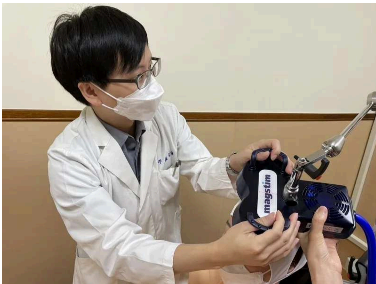
害怕吃藥副作用不敢就醫，嘉基磁波治療助憂鬱症患者重拾生活。