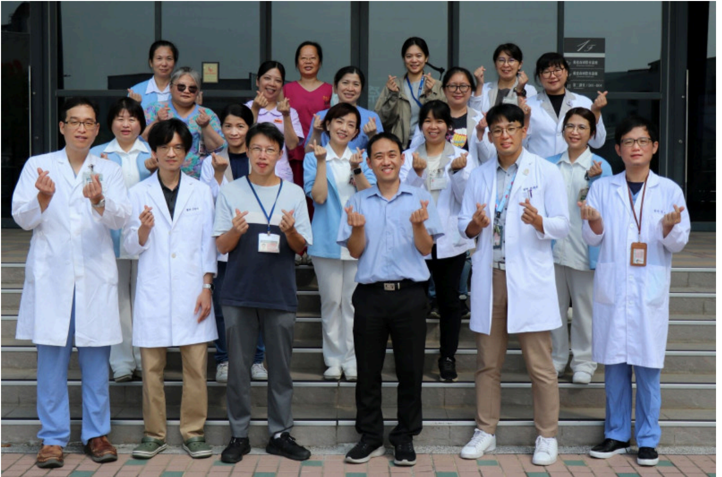
嘉基小兒髖關節發育不良照護團隊。

醫策會「小兒髖關節發育不良照護品質認證」；診間與超音波檢查室設於同一動線，無需另行預約，當天即可完成評估、收案與衛教「一站式」流程，降低家長與孩童奔波負擔與延誤風險。