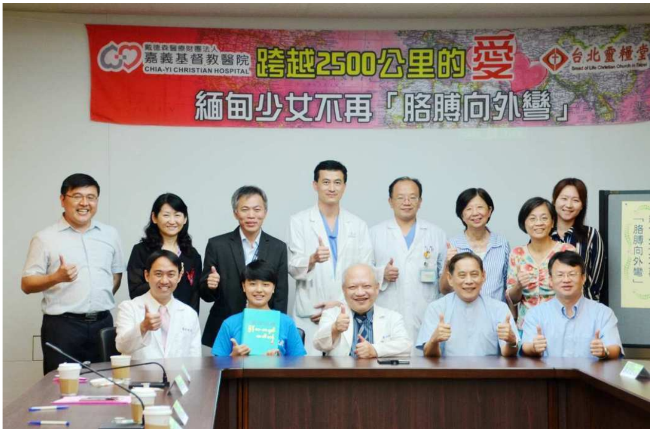
嘉基團隊體現醫療無國界的願景，完成這段跨越2500公里的義行，傳為佳話。