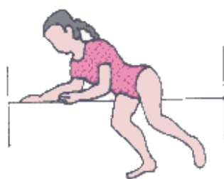
以兩手將上半身支撐 起床