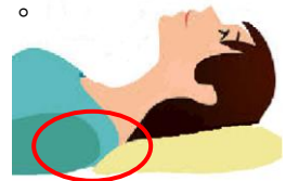
圖一 枕頭下緣置於肩下