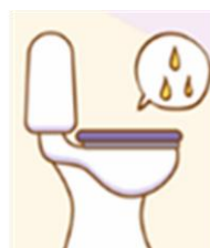
頻尿但每次只尿一點點