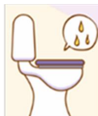
頻尿但每次只尿一點點