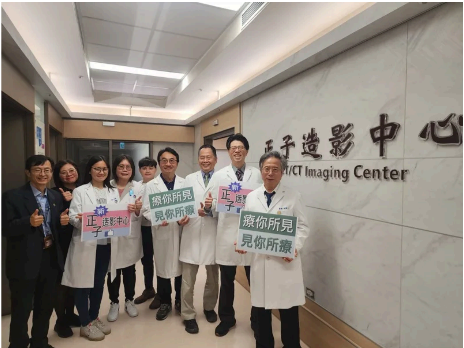
嘉基新正子造影中心啟用，提供最專業的診斷。