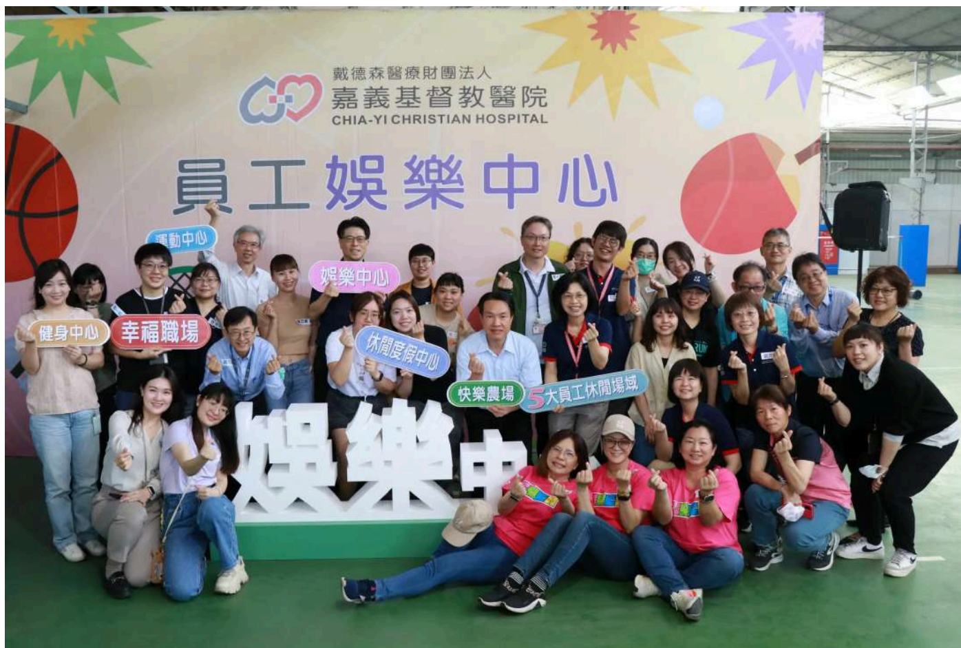
▲嘉基員工娛樂中心正式啟用。(圖 / 嘉基提供)

嘉基一向重視同仁的身心健康，院內目前已設有「健身中心」、「運動中心」及「快樂農場」等多元休閒設施。2025年4月，嘉基更領先國內醫界，推動全新福利措施，成立「娛樂中心」及「休閒度假中心」，為員工提供更多釋放壓力、促進身心靈健康的選擇。