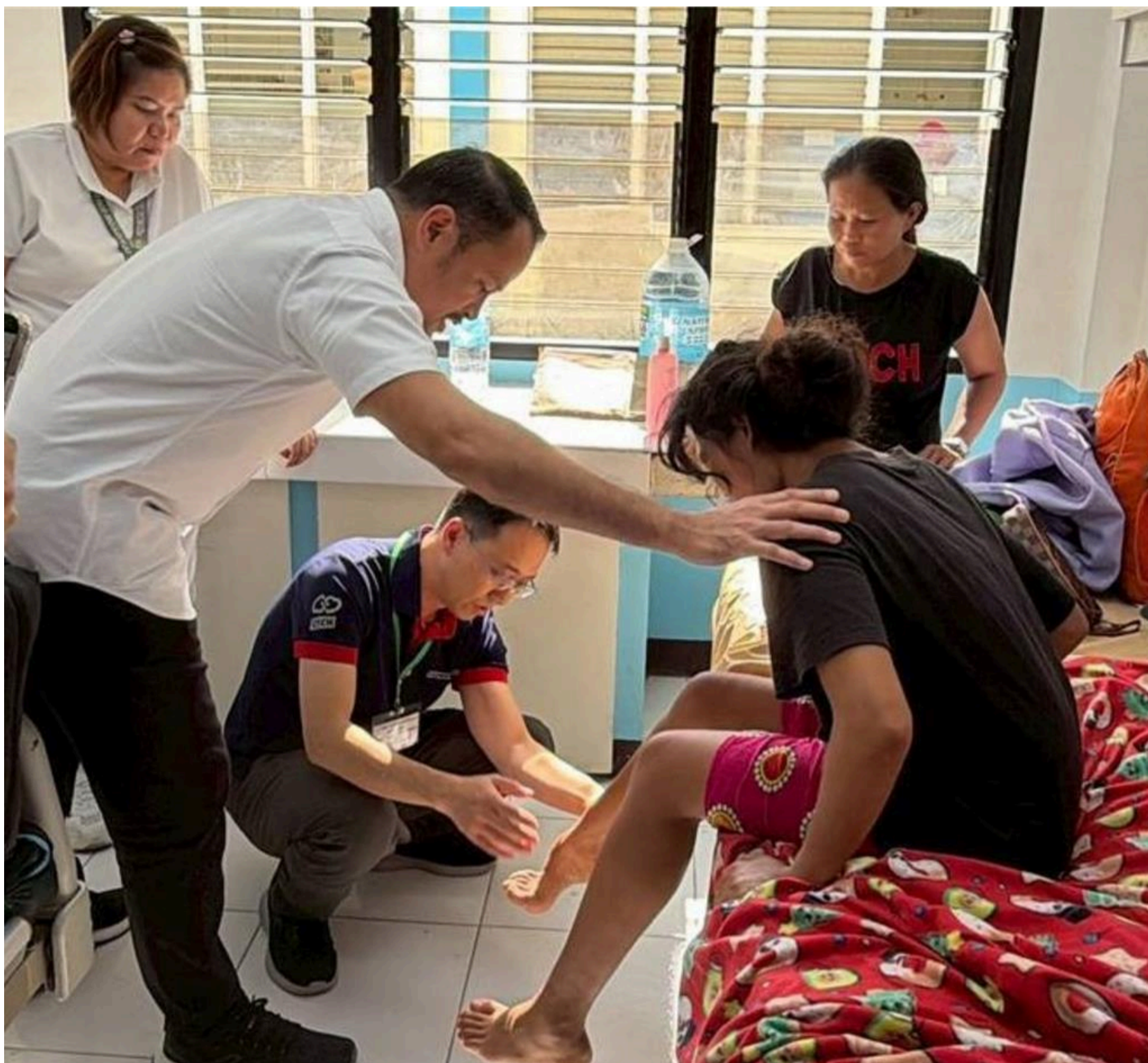
嘉基醫療團隊赴菲律賓東內格羅斯省偏鄉義診，術前訪視足部畸形少女。

此外，1名患有足部畸形的少女格外牽動醫療團隊的心，去年嘉基團隊短宣行動時首次見到她，少女因先天足部結構異常缺乏自信，且長期走路困難，影響生活與求學。