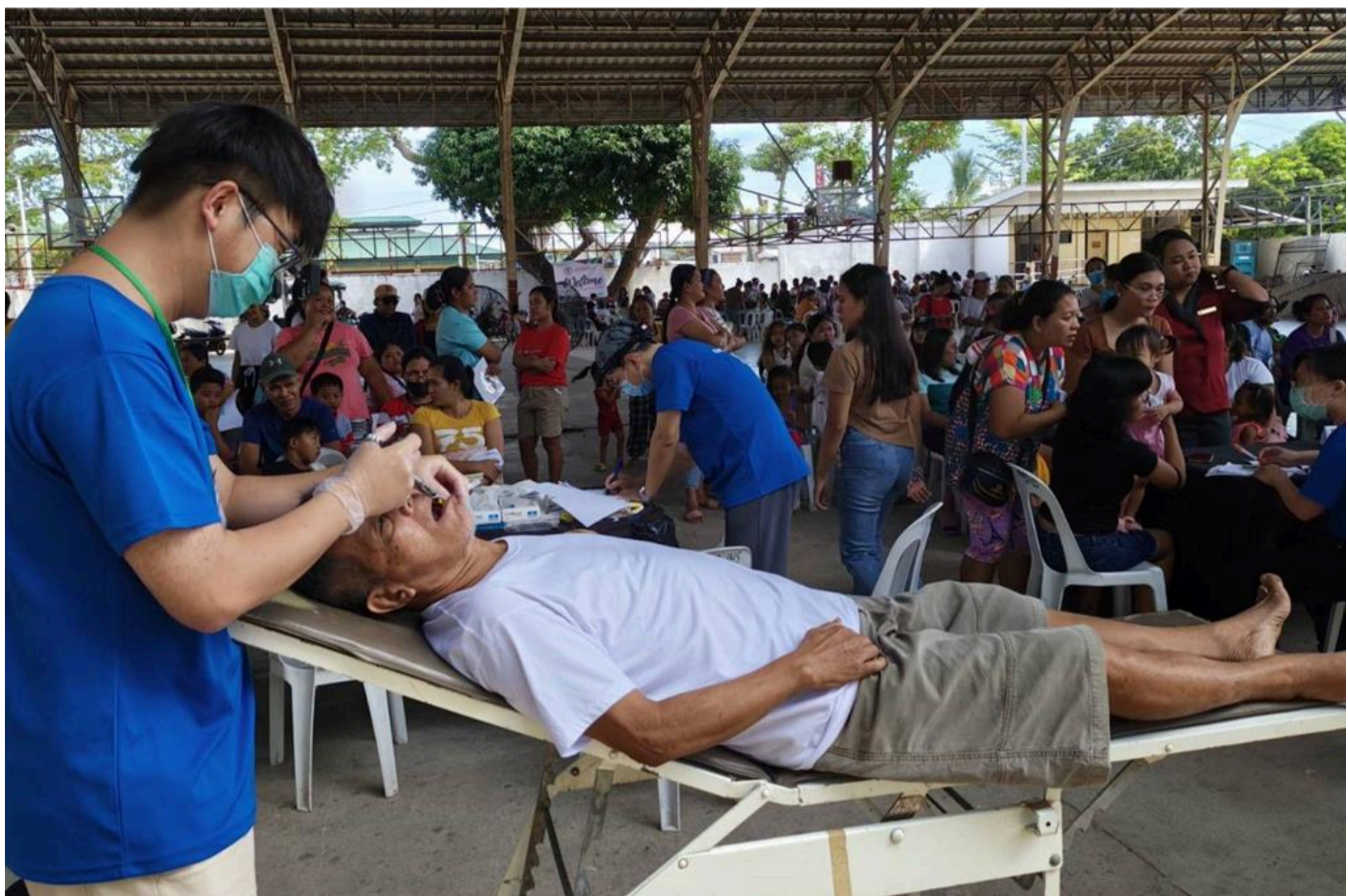
嘉基醫療團隊赴菲律賓東內格羅斯省偏鄉義診，當地就診民眾多。

嘉基還捐贈一台醫療電燒機給拜伊斯地區醫院（Bais District Hospital），協助當地醫護人員在外科處置與手術過程中，能更有效率地進行止血與組織處理，提升醫療安全與品質這項設備能為當地醫療量能帶來長遠助益。