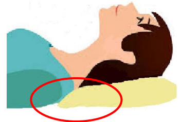
圖一 枕頭下緣置於肩下