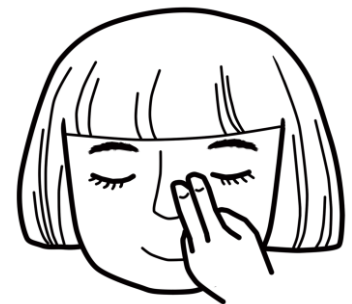
圖二 輕壓內側眼角